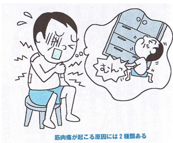
筋肉痛が起こる原因には 2 種類ある

若いうちは激しい運動をした直後か翌日に筋肉痛が出ますが、歳をとるとともに痛みが出るのが遅くなり、翌々日に筋肉痛が出る場合があります。