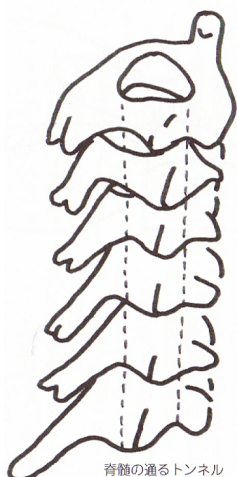
脊髄の通るトンネル

身体と首の位置関係が悪いと、朝起きたときにいつも肩がこっていたり、寝違いを起こしたり、起きた瞬間にぎっくり腰を起こしたりするようになります。このメカニズムを知ることによって、枕の正しい選び方を考えなければなりません。